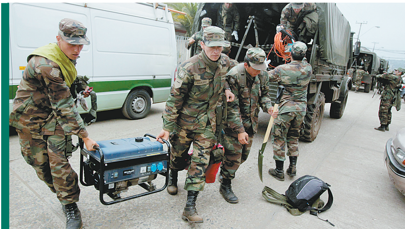
3月1日,智利士兵抵达地震灾区孔斯蒂图西翁。