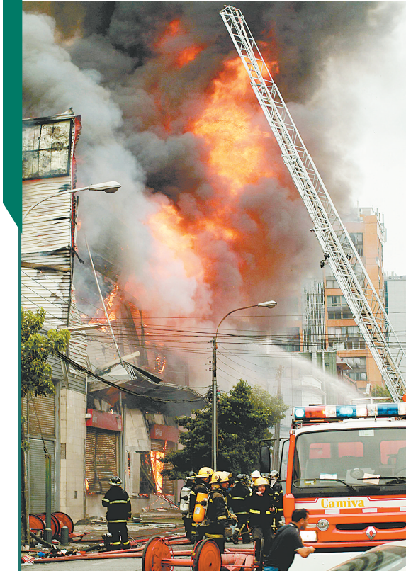
3月1日,在遭受强烈地震袭击的智利第二大城市康塞普西翁,消防队员对一幢失火的大楼实施灭火。