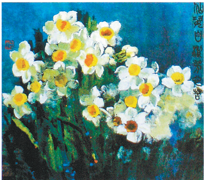
仙姿自洁芳心苦 陈兰英

《蚁居》一书,以“关注80后蚁族生存状态、剖析当代房奴现实生活”为主题,全面展现了“蚁族”在大都市高房价压力之下的生存现实。在繁华的大都市里,房子与爱情互相左右,犹如呼吸与空气一样如影随形,80后的一对年轻人,在一个以“40平方米”为圆心的圈子里演绎着他们的辛酸与无奈,爱情,苦难,挣扎,踟蹰,退缩,咬紧牙根……小说更生活化地再现了“蚁族”的身影,全面地展现了他们的奋斗,他们的挣扎,他们的浮沉。