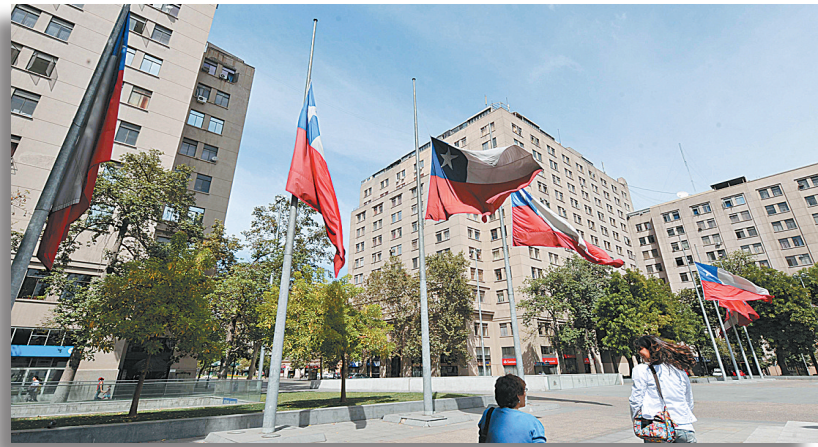
3月7日,在智利首都圣地亚哥总统府附近的广场,两位女士从国旗前走过。

据新华社圣地亚哥3月7日电 智利从7日开始举行为期3天的全国哀悼,悼念在大地震和海啸中失去生命的数百名同胞。