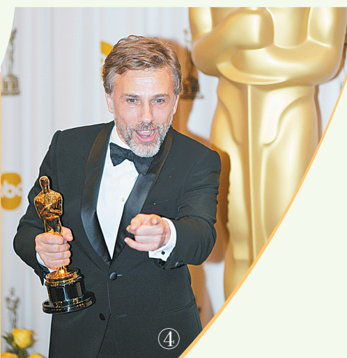
④ 克里斯托弗·华兹获最佳男配角奖