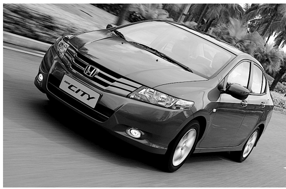
气,演绎了中级车科技时尚主义的典范。

随着去年各大车企全年销量的相继出炉,车市英雄名次浮出水面,而广本首款中级车锋范的销量成了不可错过的一个亮点。截至2009年12月23日上市一周年,锋范完成了11万辆的销量成绩,实现销量、荣誉、品牌形象成绩的“大满贯”,成为新晋中级车中的销量佼佼者。另据悉,消费者本月到广汽本田北环店参与试驾均赠送电影票2张,送完即止。