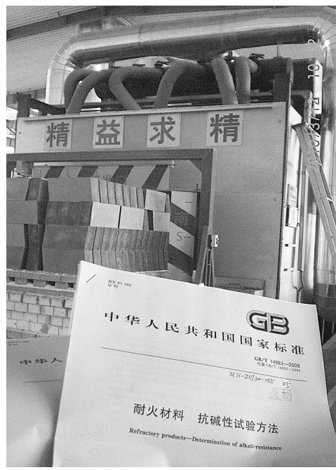
依照国家标准严格生产

1996年,巩义市政府在全市提出了质量立市的工业发展战略,把质量立市办公室设在了巩义市质量技术监督局,政府主要领导亲自挂帅。从引导、督促企业落实质量管理体系入手,建立政府推动、部门联动、企业主动的工作机制。很快企业的管理制度健全了,一个个QC小组成立起来了,一本本质量管理体系认证的证书飞到了各个企业。到2009年,巩义市近300家上规模的企业,全部通过了ISO9000质量