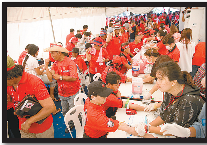
←3月16日,在泰国首都曼谷,“红衫军”集会示威者在抽血。 新华社发