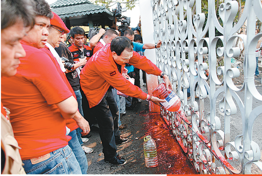
↑3月16日,在泰国首都曼谷,反政府组织“红衫军”成员将血液泼洒在总理府门前。