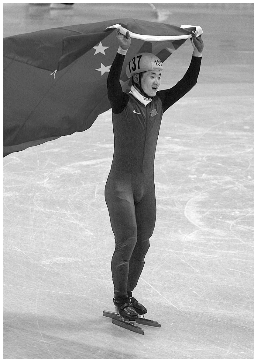
3月20日,中国选手梁文豪获胜后高举国旗庆祝。当日,在保加利亚索菲亚举行的2010年短道速滑世锦赛男子500米决赛中,梁文豪以41秒383的成绩夺得冠军。这是自2003年之后中国选手第一次夺得短道速滑项目的男子冠军。另外,在北京时间20日晚和21日晚的比赛中,中国选手王濛连续夺得女子500米和1000米两项冠军。