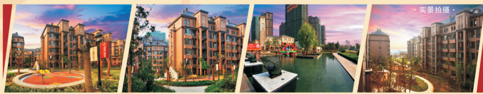
热烈庆贺 橡树玫瑰城被评为『2009影响中国的典范社区』

橡树里 City people's spiritual hometown OAK LANE 城·市·人·的·心·灵·栖·息·地