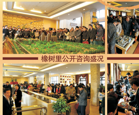
橡树里公开咨询盛况

63317777 项目地址_中州大道·航海路·南800米路东 网址_www.hnminan.com