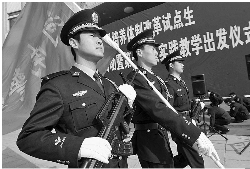
8日上午，我省警方“一警多能”教学勤务改革暨实践教学启动启动仪式在河南警察学院举行，首批367名准警察学员将充实到我市公安基层一线进行实践教学。根据河南公安工作和队伍建设需要，我省警方利用首届招录的1800名体制改革试点生的优势，以“教、学、练、战”为一体，结合实际开展实践教学改革与实践教学，全力培养“一警多能”“来之能战”的实战型和复合型人才。

制定迎接国家卫生城市复审工作考核奖惩办法，每月根据考核结果，对排前两名的专项整治指挥部予以通报表扬，分别给予2万元、1万元的奖励；综合排名前三的乡镇、街道办事处评为红旗单位，分别给予5万元、3万元、2万元的奖励，而综合排名后两名的乡镇和街道办事处挂黄旗，并给予1万元、6000元的处罚，对连续两次挂黄旗的单位挂黑旗，对主要领导进行诫勉谈话。