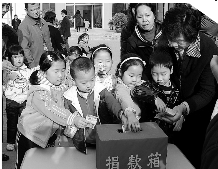
7日上午，商城幼儿园全体教师、孩子及家长排起长队，为云南等干旱地区爱心捐款，300多名孩子拿出自己平时的零花钱，捐给灾区的孩子们。