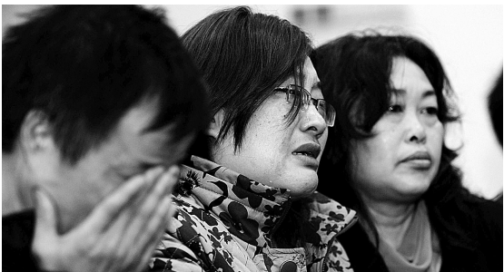
遇害者家属在法庭上含泪旁听。