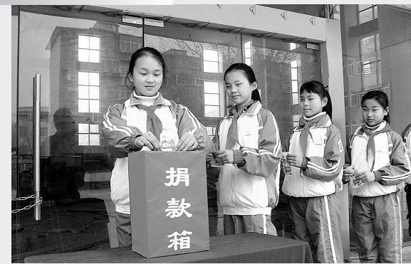
为响应团中央、全国少工委3月25日发出的团员和少先队员为灾区捐一瓶水的号召,二七区少工委向全区4万余名少先队员发出倡议:“让我们积极行动起来,向灾区人民表达自己的一份爱心。”全区少先队员踊跃参与捐款活动。