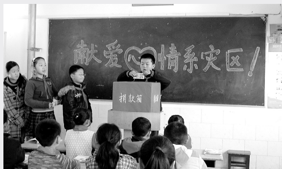
近日,金水区纬五路一小、文化路三小、金沙小学举行了情系灾区献爱心活动,同学们纷纷行动起来,以自己的实际行动向灾区献出自己的一份爱心。郑州商贾技师学院也举行了以“情系西南,水润心田”为主题的捐款仪式。