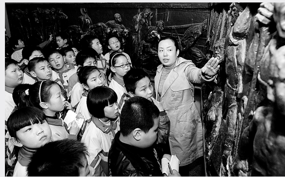
近日,经三路小学、须水镇第七小学的少先队员们,在二七纪念馆讲解员的带领下,上了一堂爱国主义教育课。