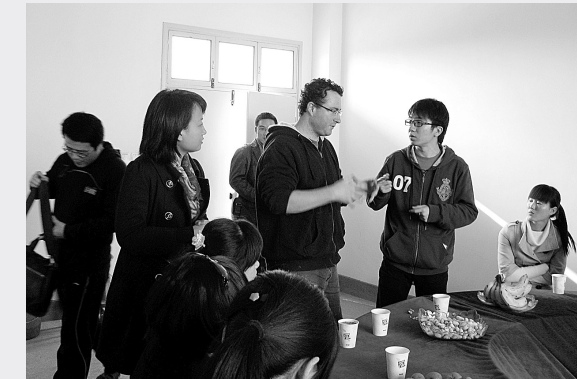
4月6日,二七区英语学科建设精英研讨论坛在侯寨乡三官庙小学举行。研讨会上,与会的老师们和外教就如何上好一节英语课,进行深入交流。