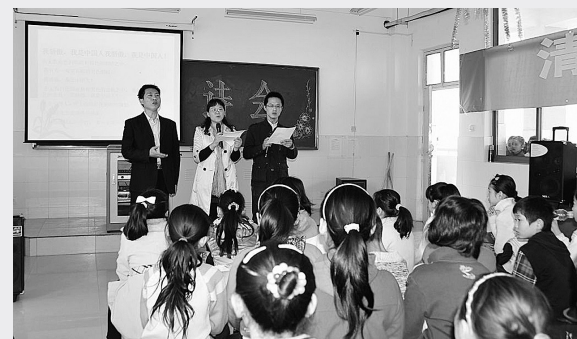
近日,郑东新区众意路小学举行清明诗会,邀请家长和孩子同台朗诵。本次活动不仅促进了家长与学校的沟通,更增进了家长与孩子们的感情。