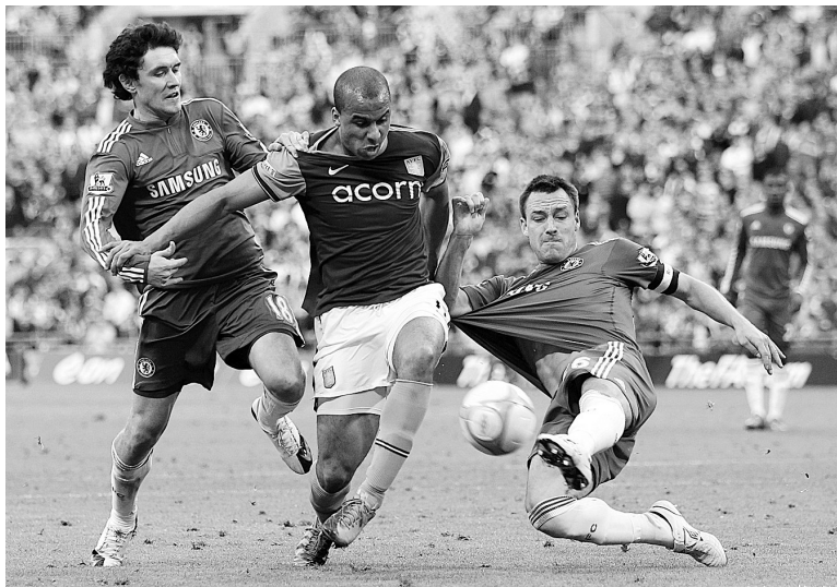
4月10日，切尔西队球员特里(右)、日尔科夫(左)防守阿森纳维拉队球员阿邦拉霍。当日，在英格兰足总杯半决赛中，切尔西队以3:0战胜阿森纳维拉队，晋级决赛。

目前，当地相关工作人员正在走村串户，积极收集资料、准备文本，准备将新密的“嫦娥传说”逐级申报为市级、省级非物质文化遗产。