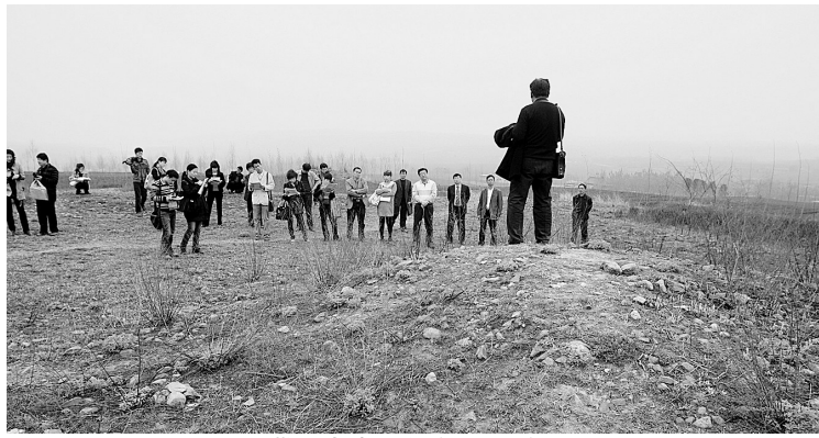
村民带记者来到新密“望月台”。

“嫦娥奔月的地方，就在我们新密。”4月9日，“河南非物质文化遗产普查重大新发现”报道团来到了新密市牛店镇月台村，村民的话让大家既新鲜又兴奋：这个神话传说中的“美女”难道真的是在新密奔月的吗？