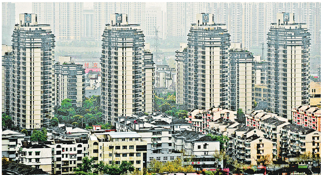
据杭州透明售房网统计,杭州市主城区二手房近日成交均价为每平方米20312元,且二手房成交量已超过新房。国家统计局发布的数据显示,2010年3月份,包括杭州在内的全国70个大中城市二手住宅销售价格同比上涨9.5%。 图为杭州市中心的一处住宅区。