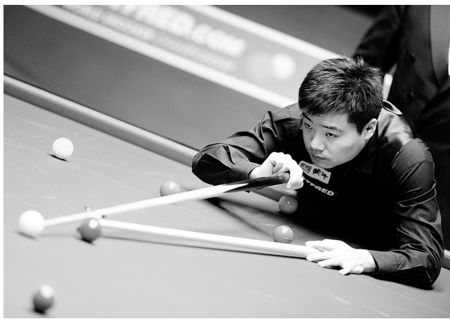
4月20日,中国选手丁俊晖在比赛中。当日,在英国谢菲尔德举行的2010年斯诺克世锦赛首轮比赛中,中国选手丁俊晖对阵英格兰选手佩特曼。

虽然面临下课的危机,但队伍的训练照常进行,打完与舜天的比赛后,全队没有休息就扎根中牟训练基地埋头苦练,昨天下午由于大雨,全队在室内进行力量训练。与北京的关键之战,内托和伤愈复出的加夫兰西奇都可以出场,而更令球迷感到兴奋的是,中原球迷渴望已久的锋线射手奥利萨德贝伤势明显好转,从随队日常训练来看,奥利萨德贝随时都可能复出,至于本场比赛奥利萨德贝能否上场,还要看教练组的安排。众多球星的及时复出,使得建业将以最强阵容迎战实力强大的北京国安,一场与命运决战的焦点战役必将成为本轮中超的最大看点。