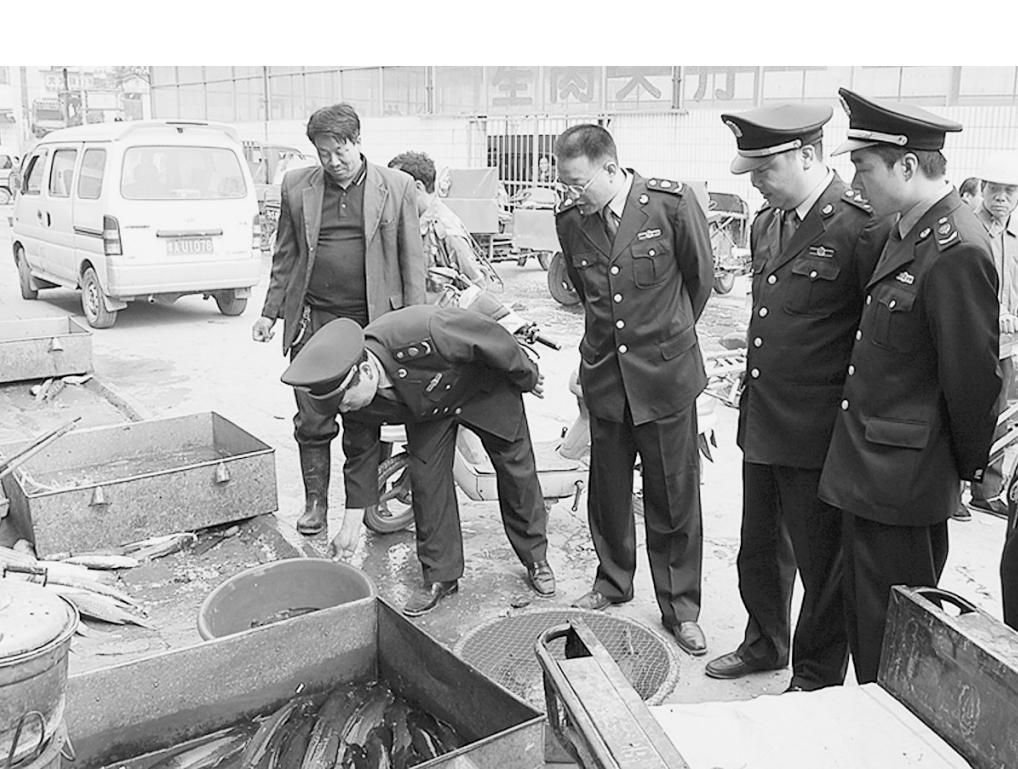
为了维护消费者利益,打击经营中的不法行为,连日来,巩义市工商局针对水产品市场存在的缺斤少两、掺杂等坑骗消费者的现象,开展专项整治活动。

本报讯(记者 张乔普 通讯员 师章玲 曹国涛)记者昨日从中牟县电业局获悉,我省内首个20千伏电压等级项目将在郑州新区白沙组团(中牟县境内)“安家落户”,郑州新区将成为20千伏电压等级引入我省的起步区,为我省积累20千伏设备维护和运行经验。 随着我国经济的快速发展,用电负荷猛增,在一些地区10千伏供电已经不能满足当地的发展需求。我国于上世纪90年代开始20千伏供电的尝试。郑州新区白沙组团内现有前程、坤泰两座110千伏变电站。其中前程变电站位于组团南部边缘,已带有部分用户。坤泰变电站位于白沙组团中心区域,仅有1回10千伏送出线路,周围10千伏网架尚未形成。目前,省委党校、河南示范职业学院等多家单位均开工建设,宇通客车配件项目近期也将入住,该区域用电负荷增长前景较为明朗,且以上用户均具备直接实施20千伏供电的条件;以采用相同导线输送相同功率电能为例,20千伏线路还可大大降低损耗。因此,我省将首个20千伏电压等级项目选在了亟须改造的坤泰变电站。 坤泰变电站改造工程动态总投资3061万元,改造期间将坤泰变电站现有10千伏出线改接至前程变电站,保证目前所供用户正常供电。 目前,坤泰20千伏改造工程可行性研究报告已经审查结束,下一步准备招标开建。