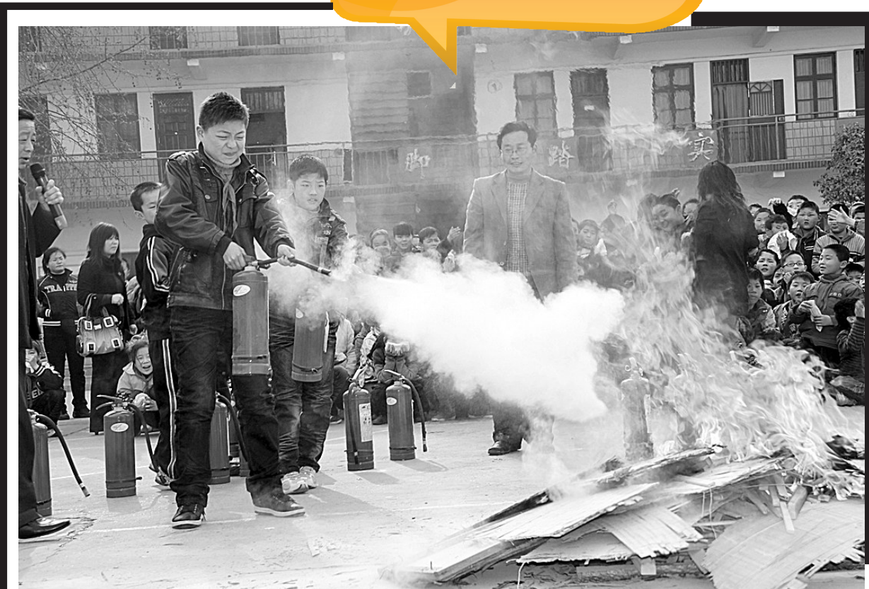
为增强中小学生安全防范意识和自我保护能力,有力推进“平安校园”建设,新郑市实验小学将今年4月份定为该校“消防安全活动月”。图为该校师生在专业技术人员指导下进行消防技能演练的情景。