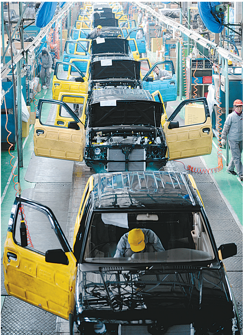
郑州日产生产线。

从2003年到2007年，郑州规模以上工业增速均超过20%。其间，全部工业增加值从500亿跳到1000亿，仅仅用了四年。而此前，从10亿元到400亿元，我们却整整用了25年。