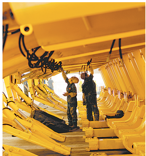
郑煤机是国内煤炭综采液压支架行业的龙头企业，有着悠久的煤炭装备制造和液压支架研发及生产历史，是我国第一台液压支架诞生地，是世界第一台放顶煤液压支架诞生地。

2010年1月17日，全市工业经济发展工作会议召开，要求全市工业系统继续实施扶优扶强、产业集聚建设和自主创新工程，加快构建现代工业体系。