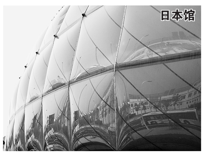
日本馆外壁覆盖有超轻的发电膜,会随着日光的变化及夜 晚的灯光变换各种“表情”。