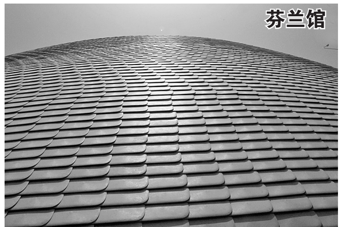
芬兰馆外墙使用鳞片状花纹纸塑复合板,主要原料是废 纸和塑料,而且全部材料都可以被回收,这种新型环保建筑材 料也是通过芬兰馆首次向世界展示。