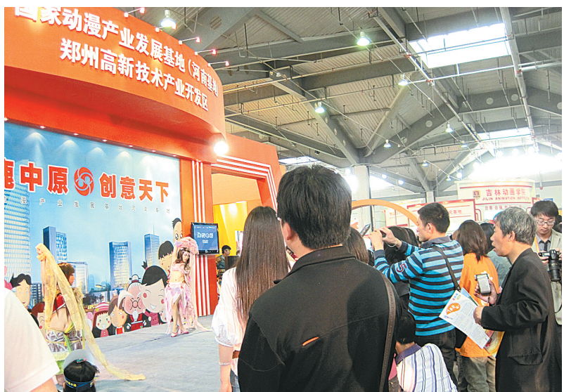
河南基地展厅前的COSPLAY表演引来不少观众的目光。