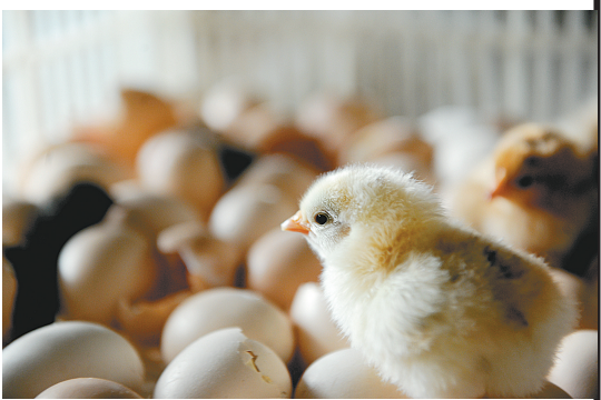
破壳一小时后的小雏鸡最漂亮。