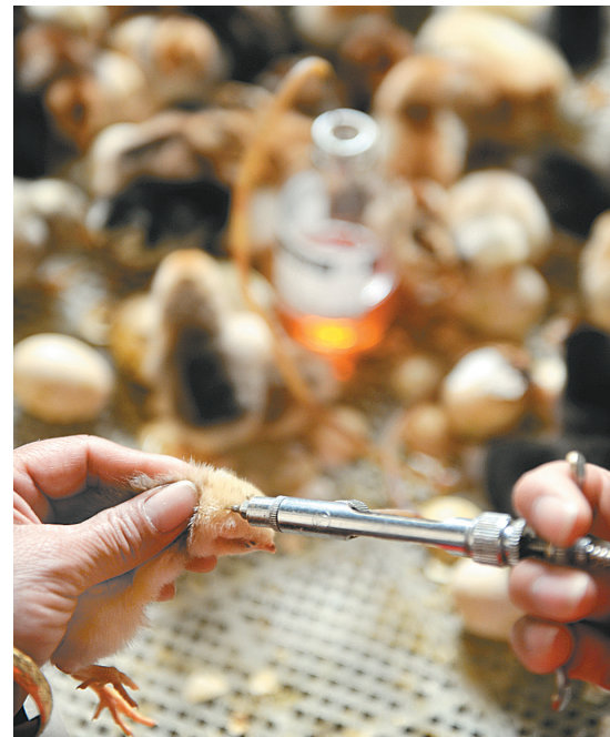
小鸡破壳后24小时之内打疫苗。