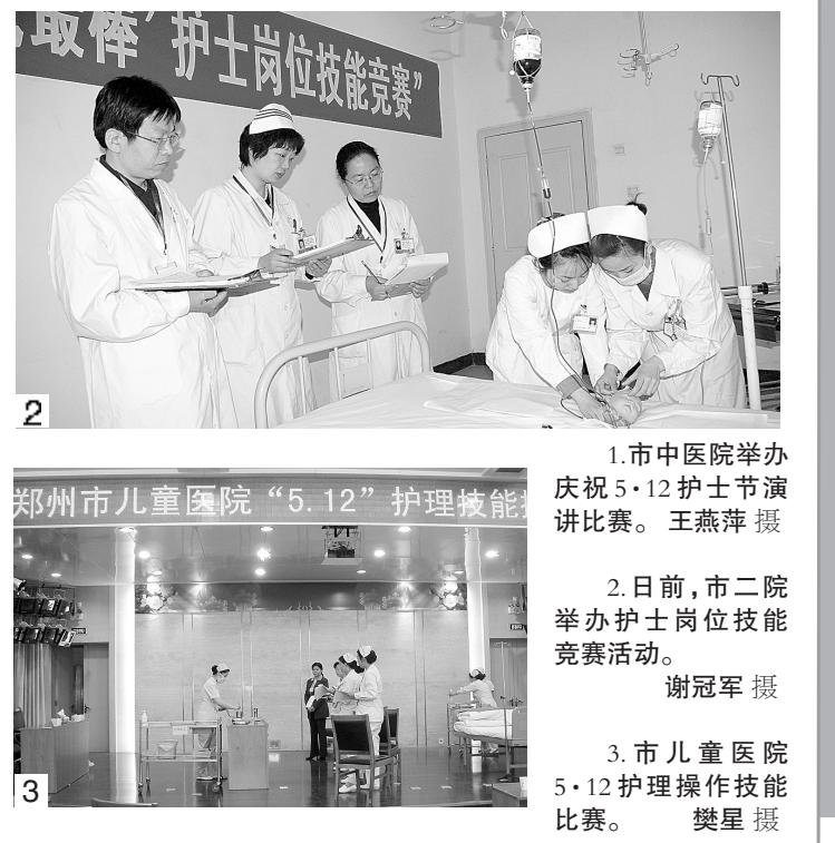
1.市中医院举办庆祝5·12护士节演讲比赛。 2.日前,市二院举办护士岗位技能竞赛活动。 3.市儿童医院“5.12”护理操作技能比赛。