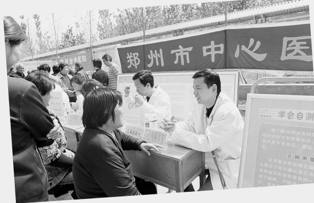
4月29日,“市卫生局长与群众面对面”活动在登封市大金店镇举行。图为市中心医院为老百姓提供健康咨询等医疗服务。