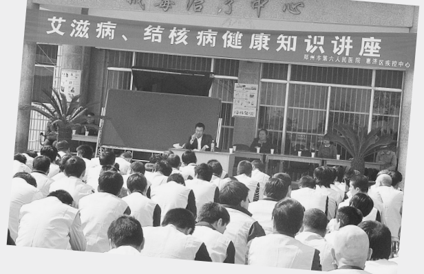
4月29日,市六院联合惠济区疾病预防控制中心对郑州市戒毒所的戒毒人员进行了结核病、艾滋病防治知识培训和宣传,活动中发放宣传资料600份,制作宣传版面6块,条幅3条。