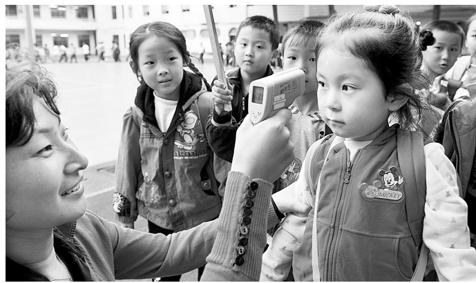
某小学教师为孩子们测量体温

连日来,我市气温逐步升高。据有关专家预测,今后一段时期手足口病疫情有反弹的可能,防控救治工作面临严峻形势。