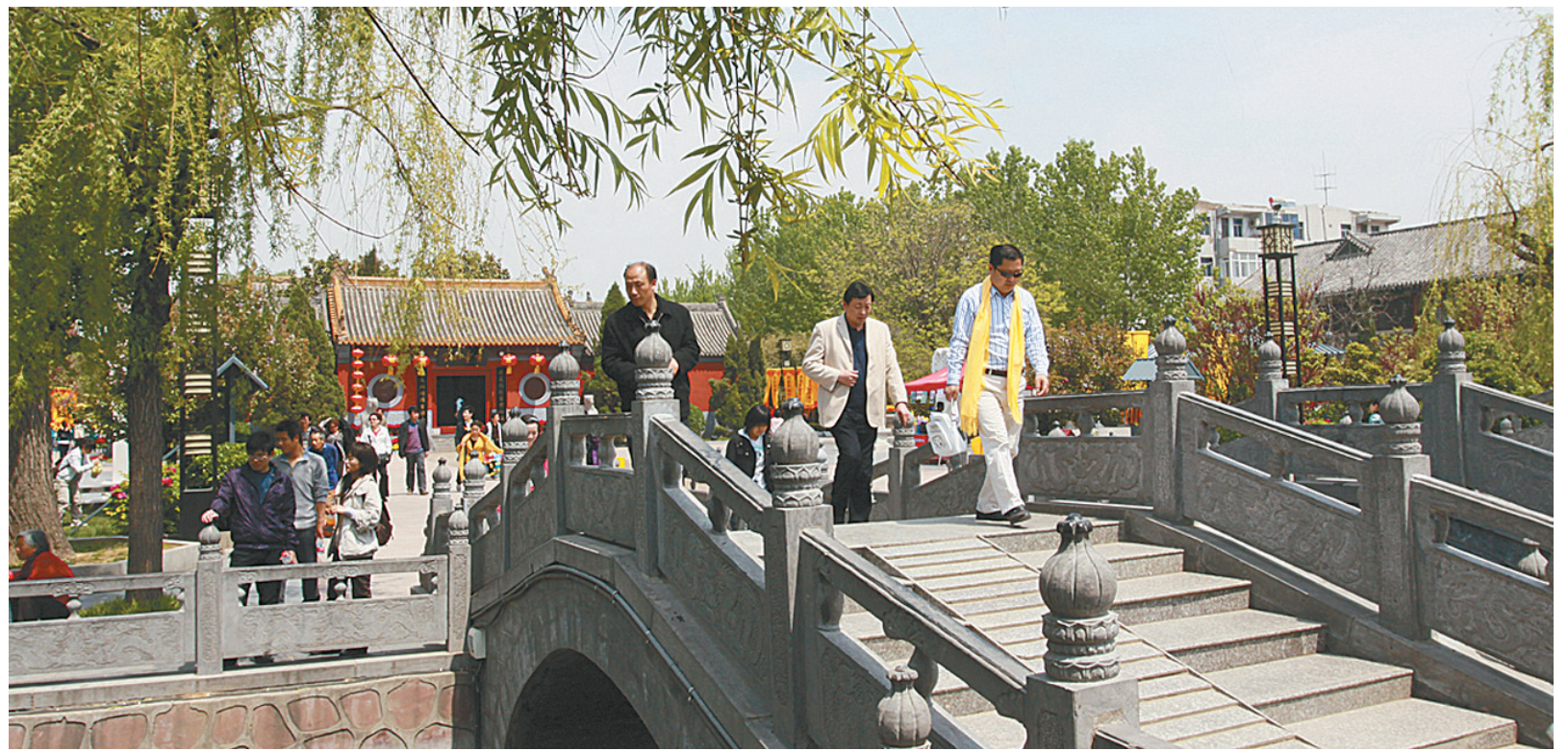
古老而神秘的轩辕桥