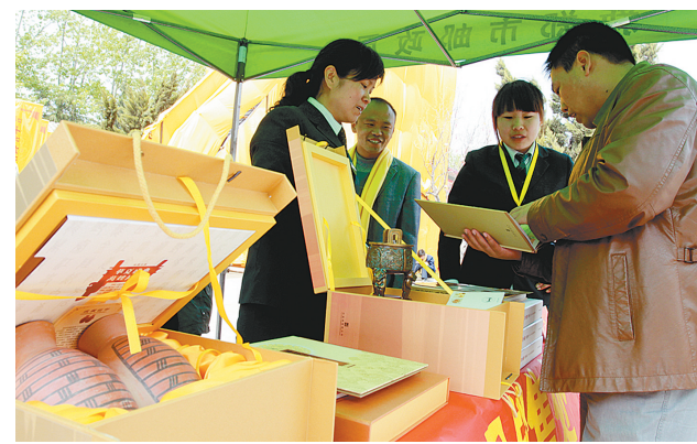
文化产品受到游客青睐