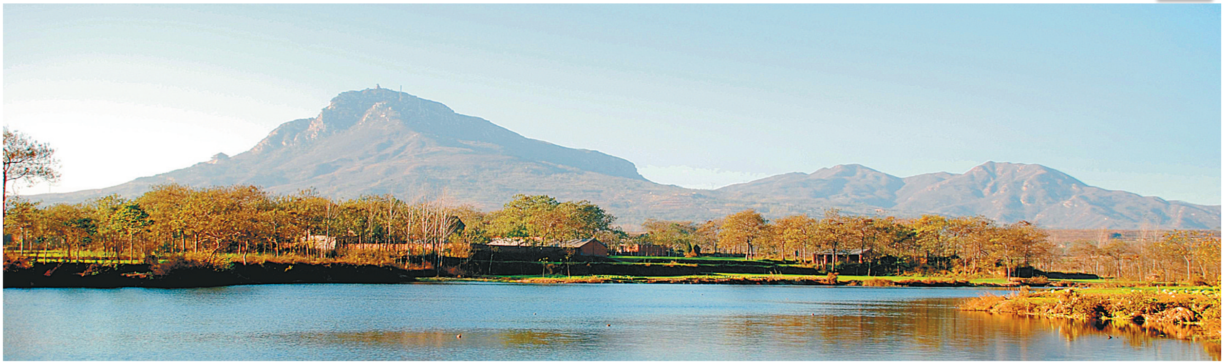
秀美的具茨山风景