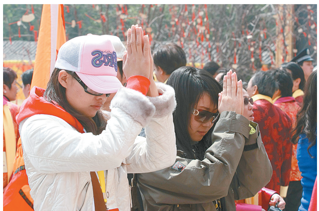
虔诚拜谒轩辕黄帝