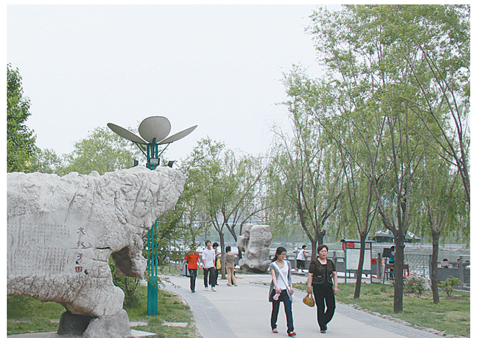
△漫步郑风苑，饱尝诗画情。