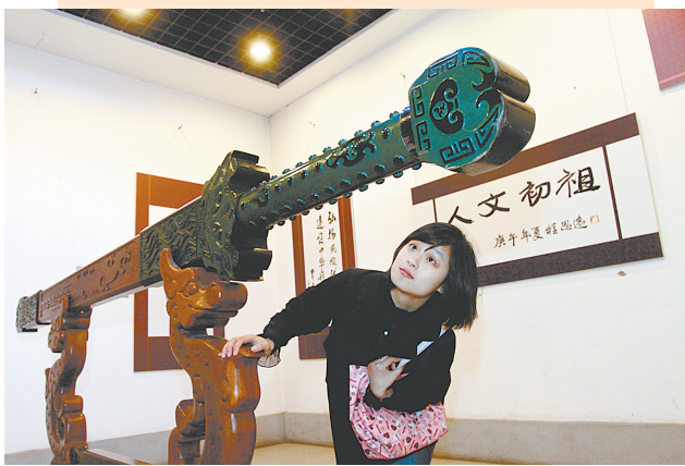
轩辕乾坤剑使游客产生了极大兴趣