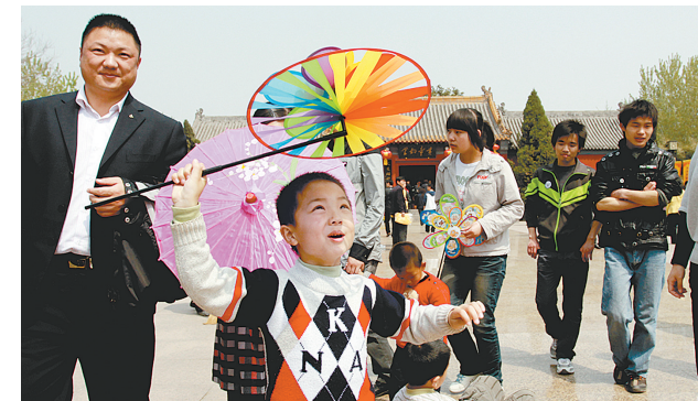
顽皮的孩子在景区找到自己的快乐