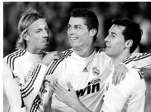
5月5日,皇家马德里队球员克·罗纳尔多(中)进球后与古蒂(左)、阿韦洛亚庆祝。当日,在西甲联赛第36轮比赛中,皇家马德里队客场以4:1战胜马略卡队。