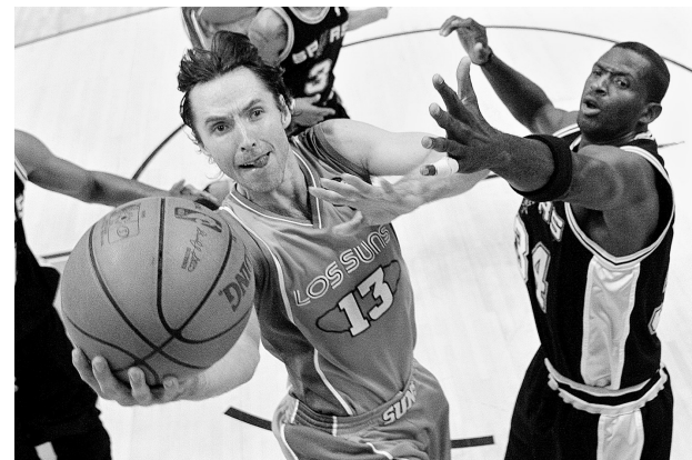
5月5日,太阳队球员纳什(左)上篮。当日,在NBA季后赛中,菲尼克斯太阳队主场以110:102战胜圣安东尼奥马刺队。