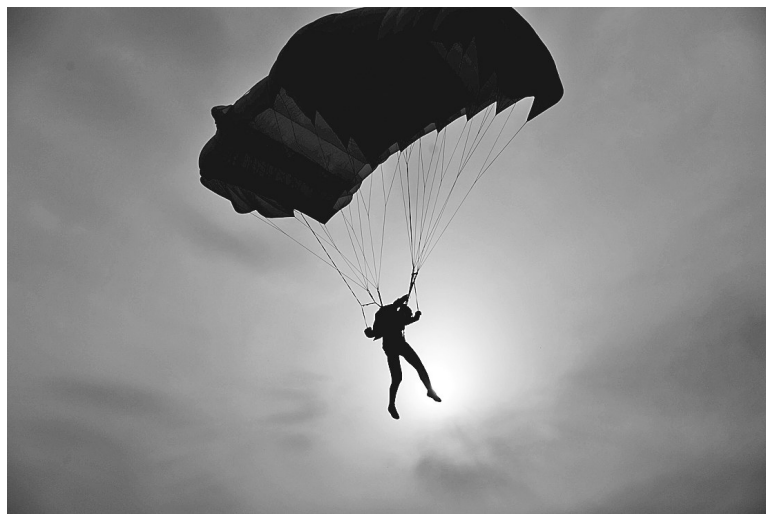
这是一名参赛选手在定点跳伞比赛中。本次四体联会的跳伞比赛为期7天,设有定点跳伞、特技跳伞、造型跳伞和花样跳伞4个项目,共有来自全国11支代表队的200余名选手参赛。