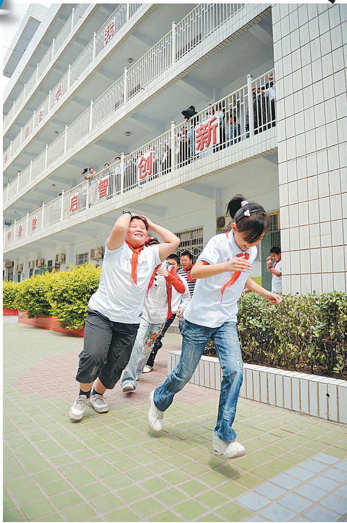
昨日，淮河东路小学的学生进行防震逃生演习。本报记者 李利强 摄

按照意见，各省辖市、县(市、区)成立地震救援志愿服务总队、大队，负责本地区地震救援志愿者行动的规划、协调、指导和活动实施；凡年满18周岁以上，身体健康、热心防震减灾和地震救援事业、具有奉献精神、具备与所参加的志愿服务项目及活动相适应的基本素质，遵纪守法的社会成员，无论职业、学历、民族、国籍、信仰，都可以进行专项注册，成为“地震救援志愿者”，就近就便、力所能及地开展地震救援志愿服务。志愿者每年要参加地震演习或专业培训，并根据各级地震部门的指导由易及难，由浅及深，围绕不同时期社会地震救援工作中心任务，以掌握防震减灾知识，开展地震灾害救援为重点，开展防震减灾宣传教育、地震灾害救援等志愿服务活动。