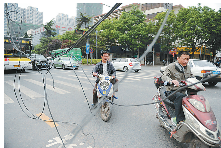
昨日，大学路与淮河路交叉口的通讯光缆悬挂空中，影响车辆和行人通行。执勤的三大队民警告诉记者，半个月来，这些光缆已被割断四次了，可能是周边夜间施工车辆造成的。

队旗。市公安消防支队、卫生局、红十字会等单位进行自救互救、支帐篷等示范演示。市公安局、人防办等单位展示了应急救援装备、车辆。在宣传周活动中，各级各有关单位还将组织开展应急救援演练、隐患排查治理、“减灾示范社区”创建等系列活动。