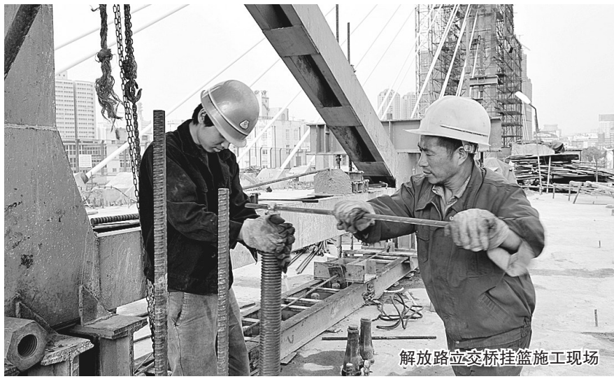
解放路立交桥挂篮施工现场

本报讯(记者 裴其娟 文)中心区铁路跨线桥是我市2007年年底开工的市政重点工程,目前,各项工程进展顺利,19对漂亮斜索已初显景观,挂篮施工稳步推进,东西引桥落地在望,预计今年年底实现整桥通车。