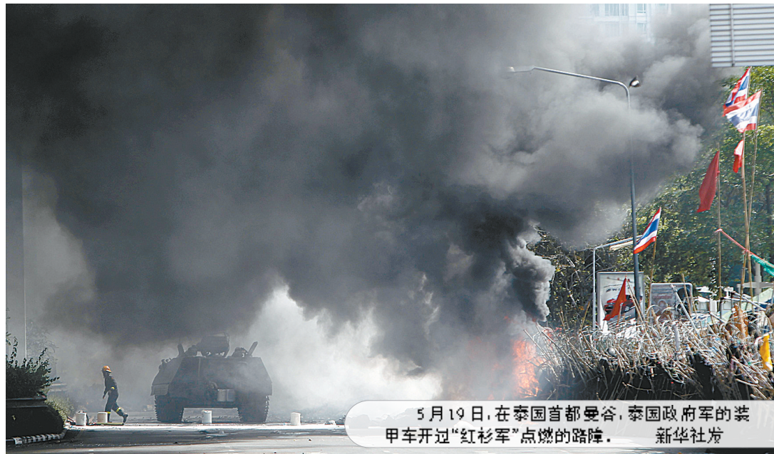
5月19日，在泰国首都曼谷，泰国政府军的装甲车开过“红衫军”点燃的路障。新华社发

5月19日，在泰国首都曼谷，泰国政府军士兵参加驱散“红衫军”集会者的行动。新华社发