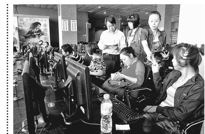
为了更好地优化火车站地区的窗口形象,19日,火车站地区文管办在火车站范围内集中展开行动,重点打击网吧、音像市场的违规经营活动。

9时15分,在市人力资源中心市场,两层服务大厅都是前来招聘的用人单位,记者走在招聘大厅内,不时有工作人员递上职位信息。市职介中心统计显示,去年同期,105家用人单位进场、招聘岗位2000多个;而今年进场招聘企业180家,招聘岗位4000多个。与之相对应的是,自上午9时到11时,进场求职人流始终稀稀落落。面对相对充裕的就业岗位,求职者尤其是大学生对于薪酬的期待也水涨船高,月薪新期待在1500~2000元之间。