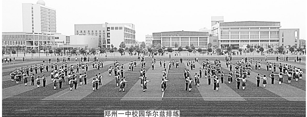
郑州一中校园华尔兹排练

在河南，许多关心教育的人和著名高校招办的领导及招生工作人员中间，有一个共同的想法：郑州一中的教育像大学的教育。郑州一中在教育中进行了怎样的基因改序，使之变成了“像大学”的教育？是“培养学生的自主精神”这一理念！郑州一中为了让学生在三年学校生活中实现这一目的，按科学发展观的思想制定了“唤醒自主意识、提高自主能力、塑造自主人格”的渐进式教育计划。为了调好“自主精神”这坛泡菜水，郑州一中在管理机制和教学模式、办学理念、德育活动、课程设置五大方面进行了多维化的创新，提出了“一制三权”思想，即民主集中制下的管理团队行政权、教学团队的学术权、学生团队的自主权。这一思想首次明确响亮地把学生自主权作为学校管理的一极。郑州一中还大力推动两种课堂建设，即主体课堂建设和自习课堂建设。两种课堂占据了课堂主阵地以后，现代学堂的传授教学将会发生革命性变化。在近五年中，郑州一中还初步建立了凸显自主特色的“S-T”教学体系。为改造僵化的传统课程体系做了取而代之的先期准备。郑州一中学生会改组了机构，设置了寝管部、伙管部，为学生搭建了自主管理的舞台，创造了从实践浸润到品格的机制。