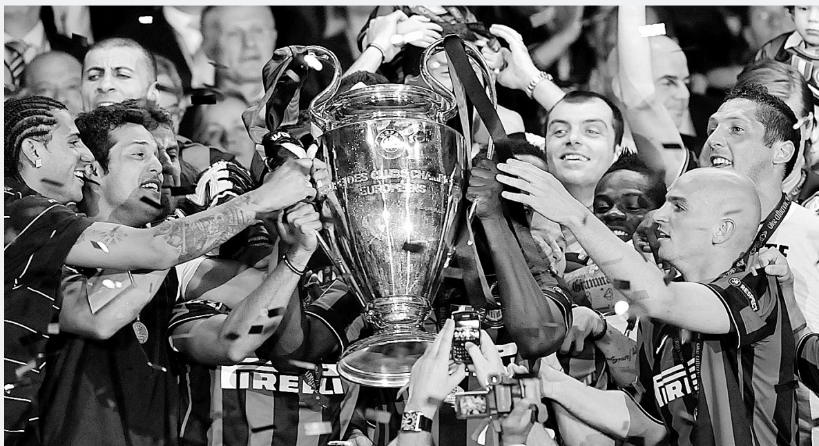
国际米兰球员触摸冠军奖杯。

第34分钟，国际米兰首开记录。米利托与斯内德做出踢墙配合后突入禁区。面对出击的布特米利托将球打入。第42分钟，米利托左路送出传中，斯内德点球附近的射门被布特奋力扑出。 70分钟，国际米兰扩大比分。米利托接到埃托奥的传球，禁区内轻松扣过范比滕，面对上来扑挡的布特射门得分。2:0。 90分钟，国米胜局已定，本场比赛梅开二度的米利托被换下接受球迷欢呼。