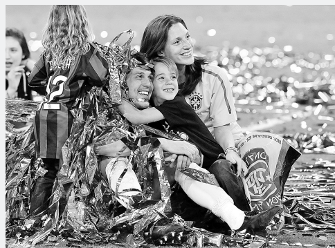
国米守门员塞萨尔赛后与亲友庆祝胜利。

他同时解释说：“目前只有皇马对我有兴趣，但我目前还没签订任何东西，我现在还是国米主帅。在这里我已经赢得了一切，在胜利面前，我不会停下脚步。”