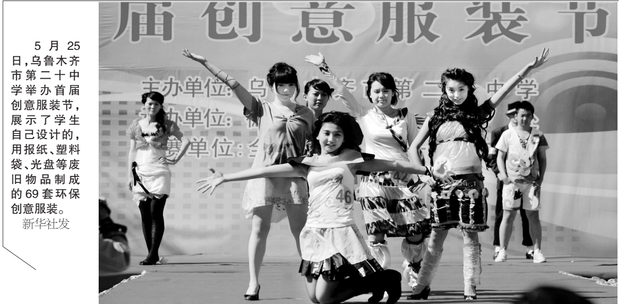
5月25日,乌鲁木齐市第二十中学举办首届创意服装节,展示了学生自己设计的,用报纸、塑料袋、光盘等废旧物品制成的69套环保创意服装。

本报讯(记者 卢文军 通讯员 苏红阳 李璐)昨日,记者从市国税局获悉,今年以来,经开区国税局多措并举,抓重点税源保收入,抓薄弱环节增收,抓新增长点促收入,实现了税收收入快速增长,前4个月组织收入2.26亿元,同比增长62.61%,绝对额和增幅均为历年同期最高。其中,就4月份单月来看,组织税收8160万元,增长195.44%,单月增幅创经开区国税局2003年建局以来最高水平。