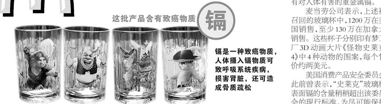
这批水杯所含的镉可渗出表面，对使用者特别是儿童有潜在危害

这批产品含有致癌物质 镉 镉是一种致癌物质，人体摄入镉物质可导致呼吸系统疾病，损害肾脏，还可造成骨质疏松