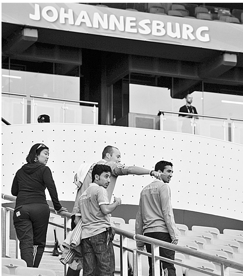
2010南非世界杯临近,南非最大的球场——足球城体育场硬件施工全部完成,正为世界杯开幕战做最后准备。足球城体育场是南非最大的球场,始建于1989年。为了更好地迎接世界杯,自2006年开始,南非政府斥巨资33亿兰特(约合4.4亿美元)将球场升级,球场容量由8万人扩建成94700人。今年南非世界杯的揭幕战和决赛都将在这里举行。图为工作人员正在体育场内为世界杯开幕式和揭幕战做准备工作。