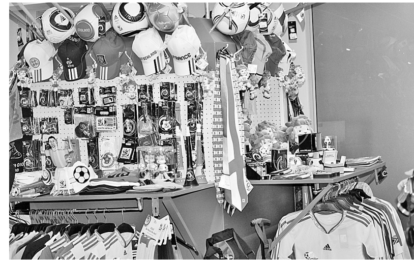
世界杯商品琳琅满目。 本报记者刘超峰发自南非约翰内斯堡