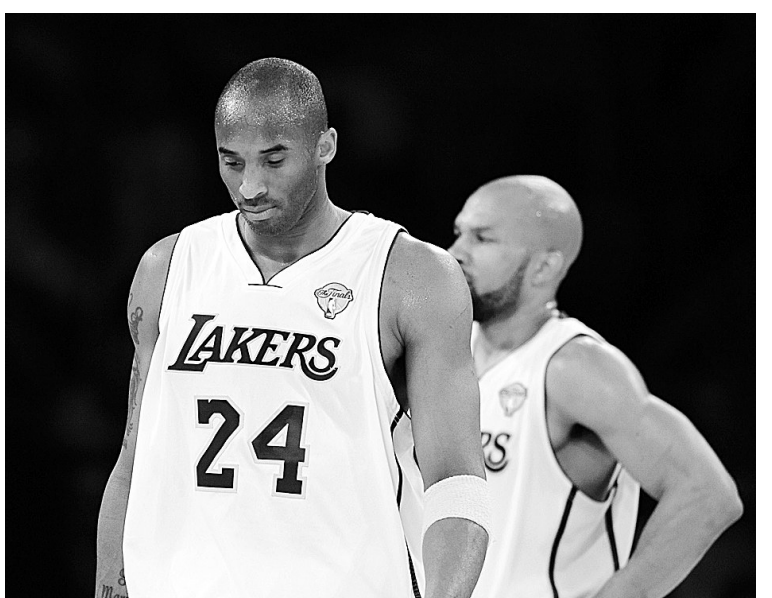
湖人队球员科比(左)和队友在比赛中。