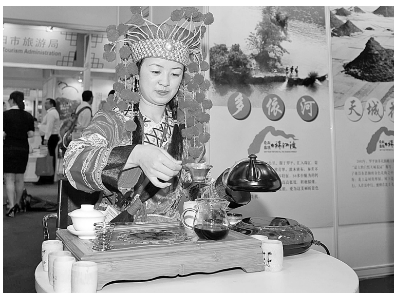
6月10日,第24届香港国际旅游展暨第5届商务及会展旅游展在香港会议展览中心开幕,吸引了来自欧洲、美洲、亚洲、非洲和大洋洲的45个国家和地区的600多家参展商。图为一名工作人员在云南曲靖的展台前展示普洱茶冲泡方法。