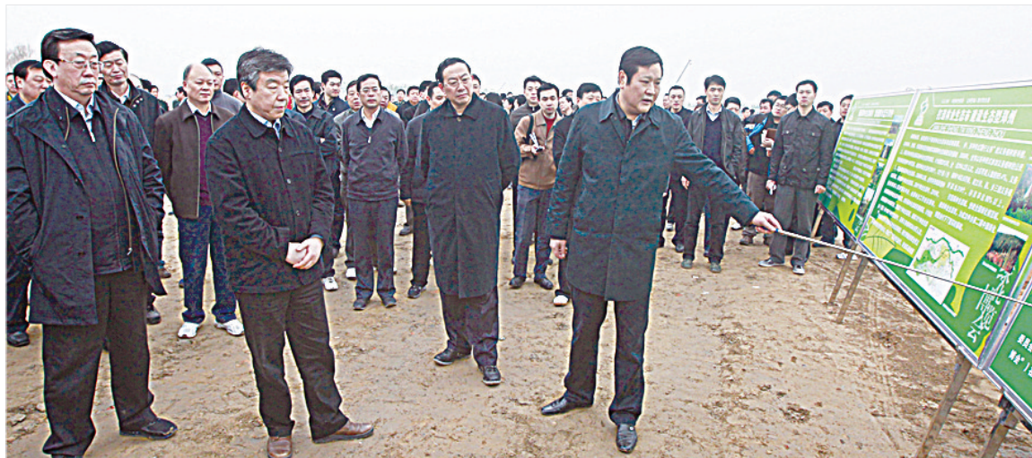
省委书记卢展工(左二)、省长郭庚茂(左一)、郑州市委书记王文超(左三)在绿博园听取郑州市市长赵建才关于第二届绿博会筹备情况的介绍。