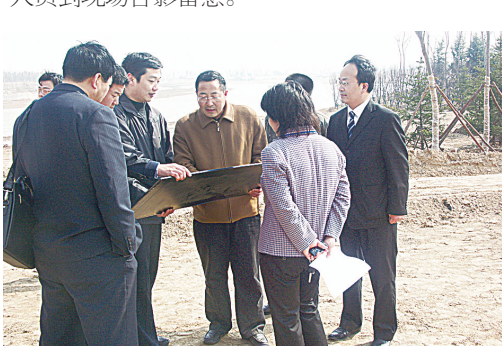
嵩山饭店请河南农业大学园林规划设计院、绿博园项目部、山东省5家参展建园城市一同在绿博园商讨山东园规划。

位沟通,详细介绍绿博会的意义和有关情况,介绍郑州市情。经过不懈努力,青岛市最终决定参展。