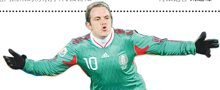
6月17日,墨西哥球员瓜·布兰科罚点球后庆祝。墨西哥队最终2:0击败法国,出线在望,上届亚军法国队则濒临出局。