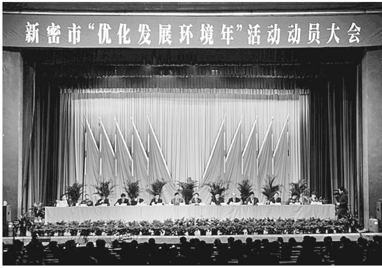
新密市民主评议动员大会会场(资料图片)

于是,整个新密市刮起了一场环保风暴。恰巧,全国此时也开始了一场声势浩大的环保风暴。借助全国刮起的环保风暴力量,新密市