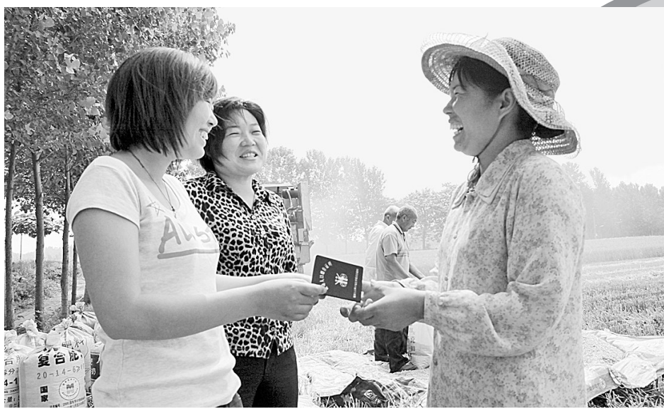
新郑市抓住“三夏”流动人口集中返乡的有利时机,多形式、多渠道为流动人口开展计划生育维权服务活动。图为新华路计生办工作人员到田间为流动人口办理流动人口证。

开展“亮牌示范”活动。把开展党员“亮牌示范”活动作为发挥党员先锋模范作用,提高创先争优活动影响力的主要举措,通过建立党员先锋岗、划分党员责任区等形式亮明党员身份,使党员的先进性看得见、摸得着,进一步树立了党员的良好形象。活动开展以来,该局各级党组织共建立党员先锋岗10多个,开展亮牌服务活动12次,帮助解决群众生产生活实际困难10多件。