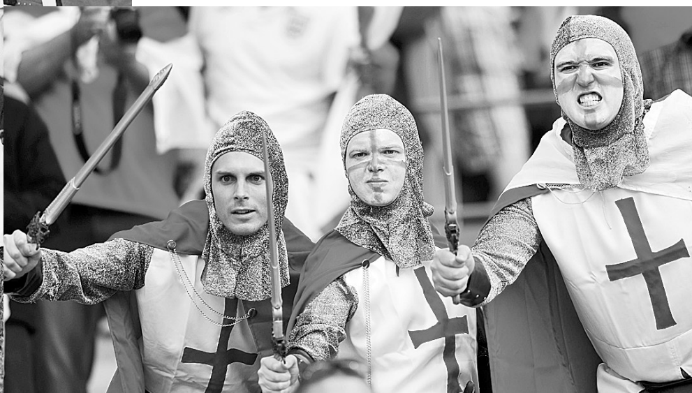
英格兰队球迷在看台上“自娱自乐”。