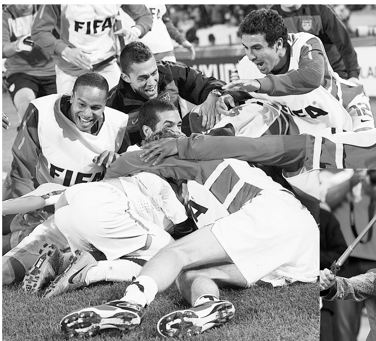
美国队球员庆祝胜利。