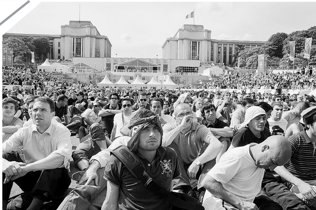
6月22日，一些法国队球迷聚集在巴黎埃菲尔铁塔前观看2010年南非世界杯法国队与南非队的比赛。法国队最终在A组最后一轮的比赛中以1:2不敌南非队，从而以三战一平二负积1分的战绩告别世界杯。