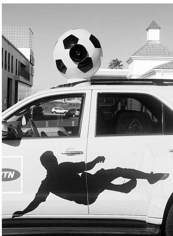
世界杯的举行使南非各地成为一座座足球城市，包括“普天同庆”在内的各式足球成为最显眼的城市建筑标志。图为带有足球元素的涂装车辆停放在南非街头。