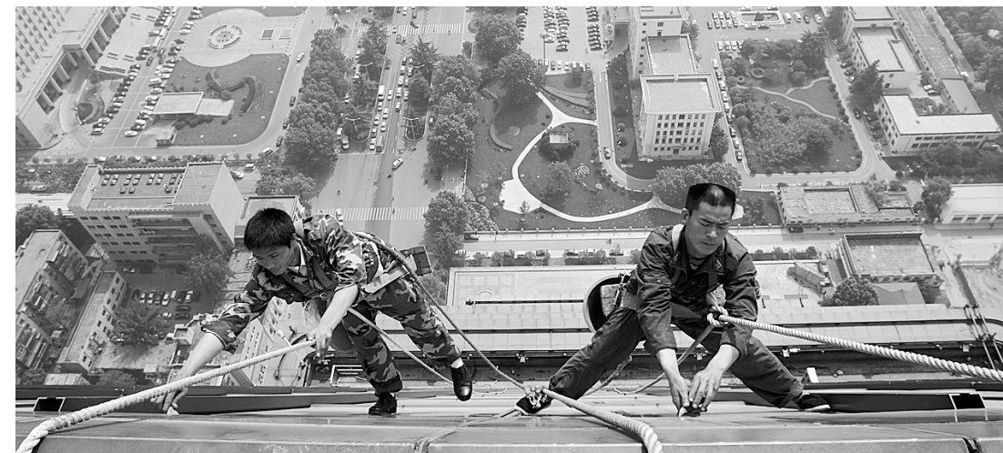
下图 烈日下,高空“蜘蛛人”仍在为玻璃幕墙“洗澡净身”。

入夏以来,绿城持续高温,不少精明的商家、景区从中觅得诸多“清凉”商机,周边山水景区及游乐浴场成为市民避暑休闲好去处。