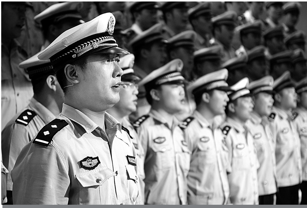
昨日，郑州市公安局特巡警支队开展了以“弘扬东精神，唱响红色歌曲，重温入党誓词”为主题的教育活动。“立警为公最公正，执法为民为本，政治强、纪律严、方向明……”一曲曲饱含热情的歌声回荡在支队礼堂内。

今年年底前，省交通投资集团争取开工高速公路项目还有8个，总投资287.52亿元。包括机场至少林寺高速公路、武陟至云台山高速公路、焦桐高速温县至巩义段、焦桐高速登封至汝州段、尧山至栾川高速公路、栾川至西峡高速公路、三淅高速三门峡黄河桥、三淅高速卢氏至西坪段。