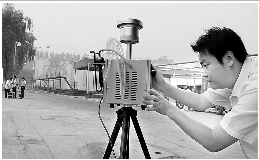
上图 参加应急救援演练的消防救援人员严阵以待。 右图 环保部门检测事故现场及周边环境污染情况。 下图 数十条水龙瞬间将火魔降伏，并对化工原料罐体进行冷却，防止复燃复爆的发生。