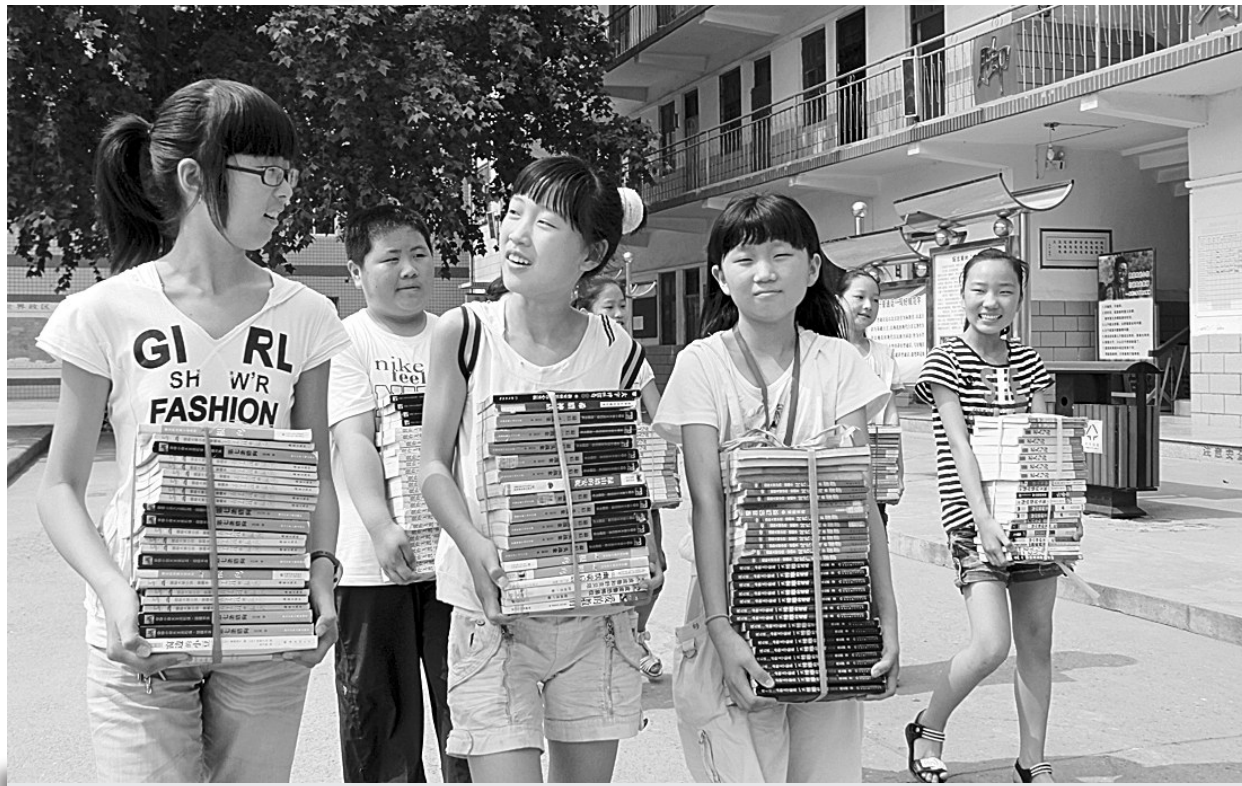
本报讯(记者 高凯 李伟彬 文/图)近日,新郑市实验小学六年级毕业生将用过的课本、辅导书、课外书等1000余册捐赠给母校,供在校的同学阅读。