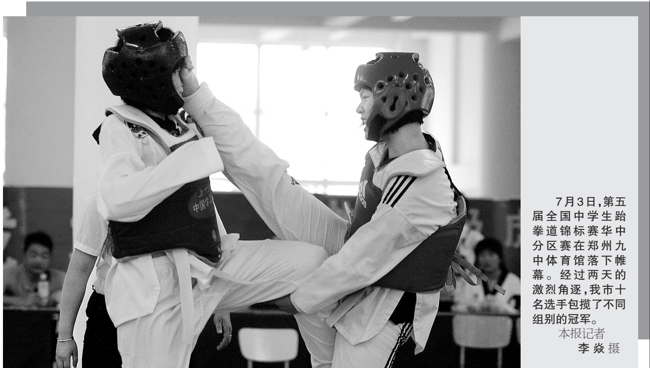
7月3日,第五届全国中学生跆拳道锦标赛华中分区赛在郑州九中体育馆落下帷幕。经过两天的激烈角逐,我市十名选手包揽了不同组别的冠军。