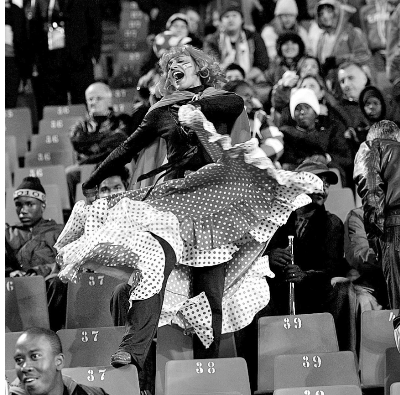
上图：西班牙队球迷在看台上跳起西班牙舞。 右上：德国球迷在首都柏林的“足球世界杯狂欢节”露天放映场狂欢。 右下：阿根廷队球迷在比赛后神色黯然。