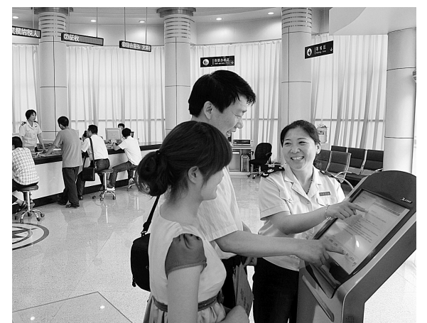
新郑国税的优质服务赢得了客商的高度称赞。