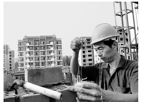
工人们冒着高温酷暑加紧建设重点民生工程——经济适用房。