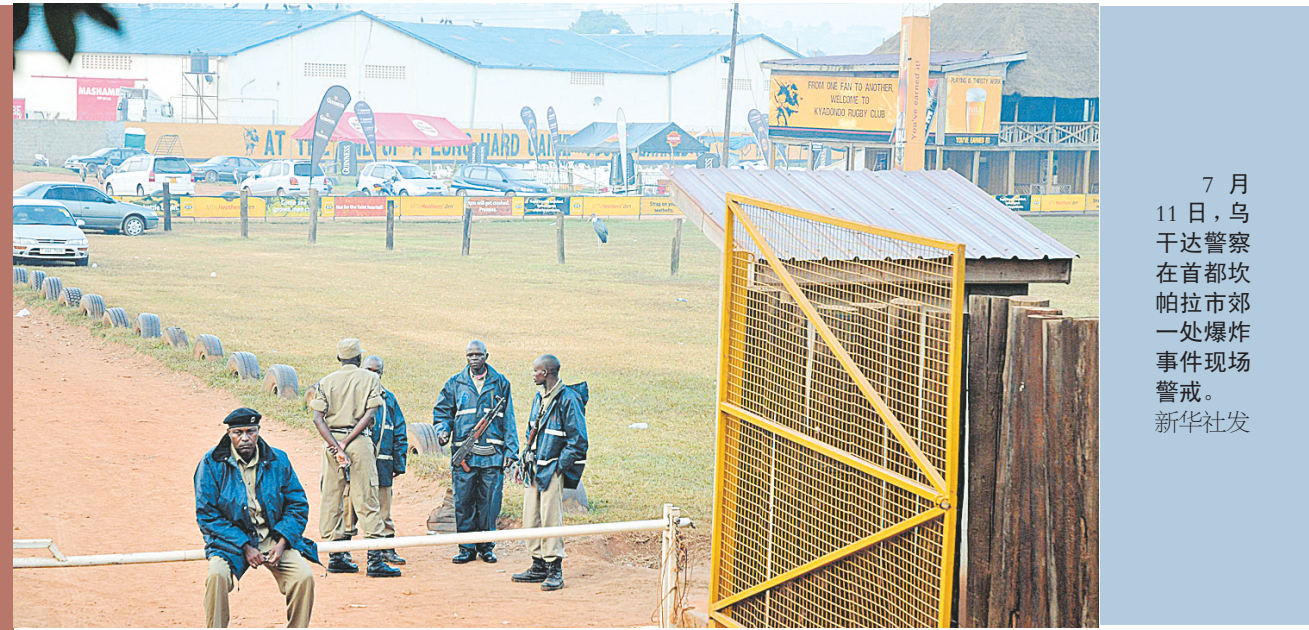
7月11日，乌干达警察在首都坎帕拉市郊一处爆炸事件现场警戒。

此前，“伊斯兰青年运动”曾声称将于近日对乌干达和布隆迪驻外使馆发动袭击，以此对非洲联盟驻索马里特派团行动造成干扰。