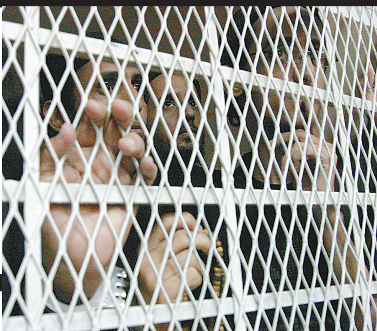
7月11日，“基地”组织犯罪团伙部分成员在法庭上接受审判。