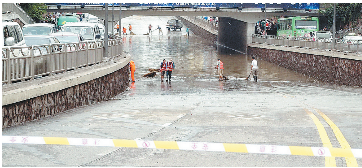
昨日，陇海路京铁路桥下被淹。本报记者 唐强 摄

根据最新的天气形势分析，我市未来几天以阵雨为主，20日，阴天间多云。21到22日，阴天间多云，有短时阵雨、雷阵雨。