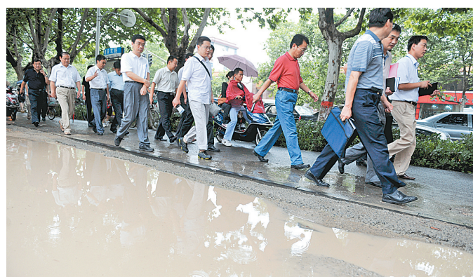
昨日，建设路红线范围内因硬化不到位，一场大雨过后，路面坑洼不平，造成不同程度的积水。本报记者 李利强 摄